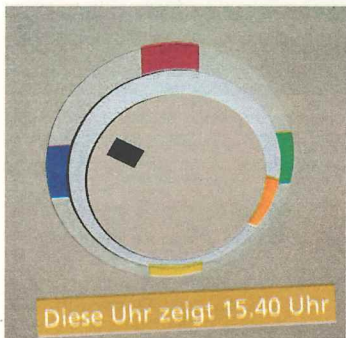
Diese Uhr zeigt 15.40 Uhr